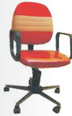
PC 038 Mini Prince