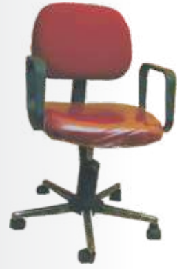
PC 037 Mini