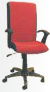
PC 052 Low Back Karizma