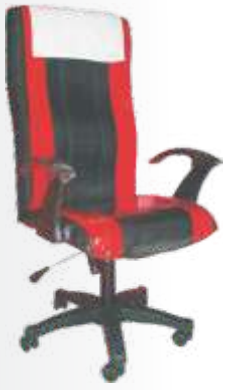
PC 030 karizma