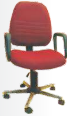
PC 039 Prince